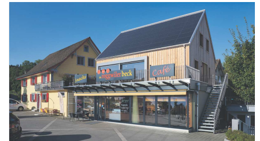
Gebäudeaufbau «Roggwiler Beck»