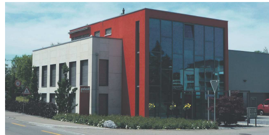
Wohn- und Gewerbehäuser Stachen