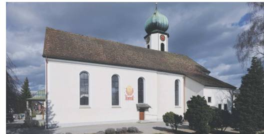
Fassadenrenovation Pfarrkirche St. Jakobus Steinach