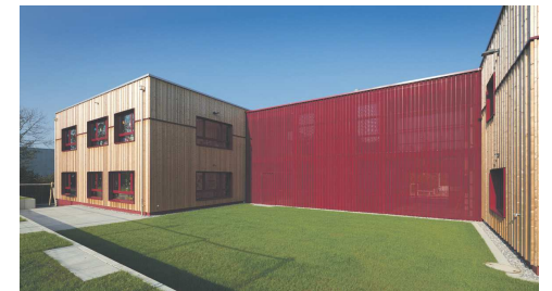
Neubau Doppelkindergarten Roggwil