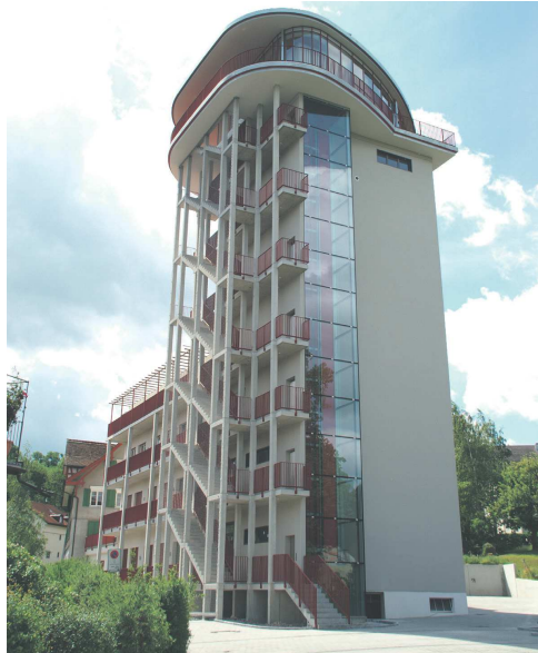
Umnutzung der Mühle Roggwil zum modernen Geschäftshaus