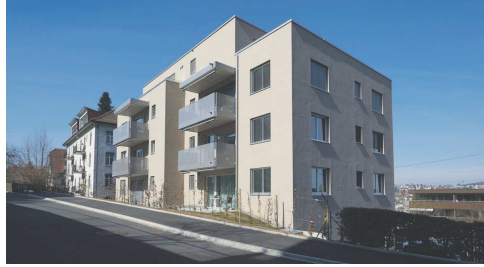
Mehrfamilienhaus St. Gallen